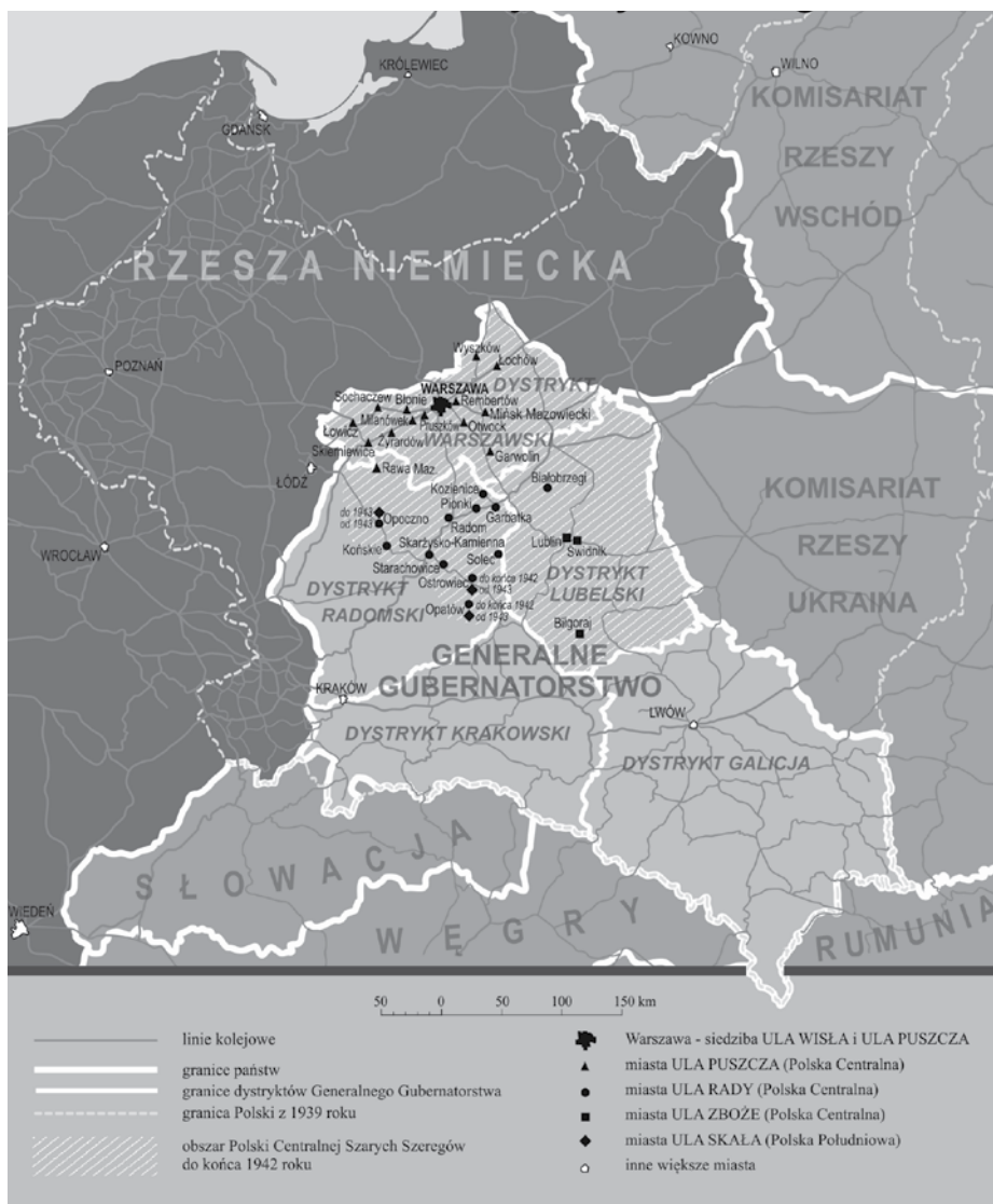
fot. 22. Mapa zasięgu działania wizytatorów Polski Centralnej Szarych Szeregów