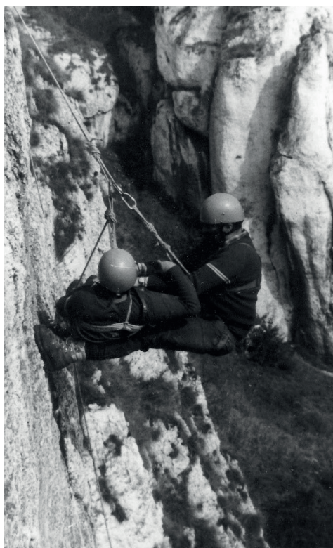
Fot. 2, 3. Elementy szkolenia ratownictwa górskiego z Grupą Beskidzką GOPR w Kobyłanach 1982 r. jako przygotowanie do organizacji rajdów „Azymut”