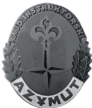
Fot. 6. Odznaka Rajdu Instruktorskiego „Azymut” w stopniu brązowym