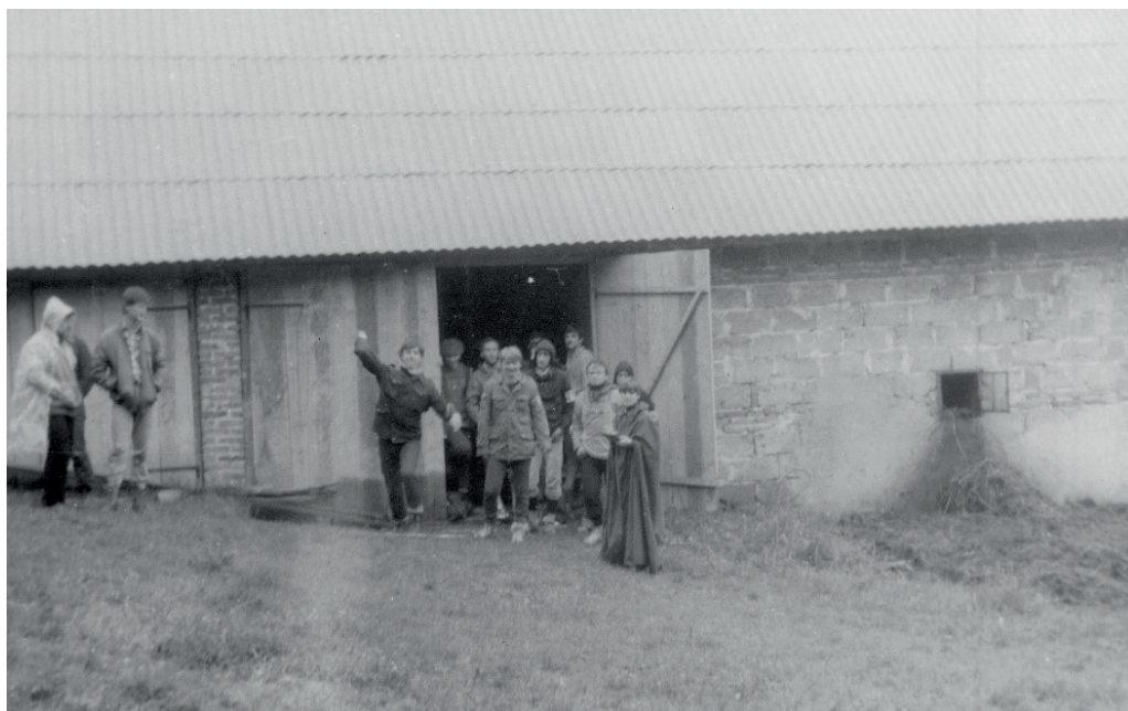
Fot. 5. Zawody sportów obronnych (rzut granatem), Hucisko 1985 r.