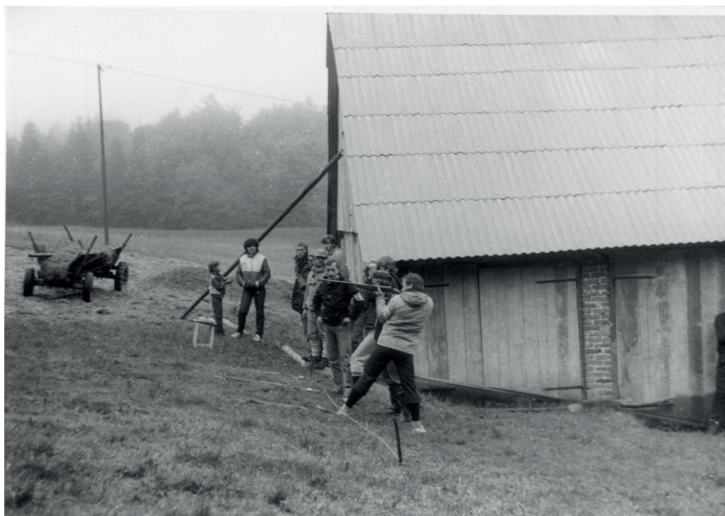
Fot. 4. Zawody sportów obronnych (strzelanie z kbks), Hucisko 1985 r.