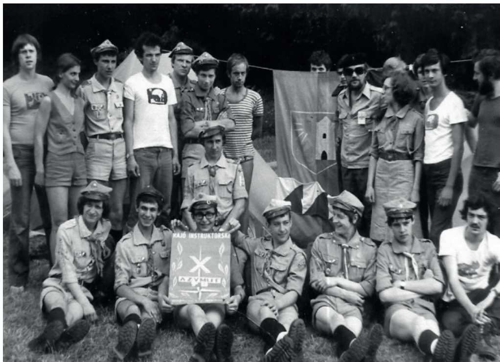
Fot. 7. Zwycięskie patrole w Jubileuszowym X Rajdzie Instruktorskim „Azymut” w Sidzinie, 1979 r.