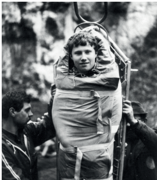
Fot. 2, 3. Elementy szkolenia ratownictwa górskiego z Grupą Beskidzką GOPR w Kobyłanach 1982 r. jako przygotowanie do organizacji rajdów „Azymut”